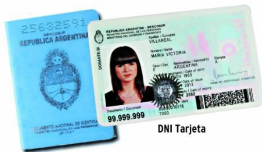
DNI Tarjeta con Libreta celeste

SOLO VERSIÓN DIGITAL DE DNI Y LIBRETA (NO CON ESCRITURA MANUAL)