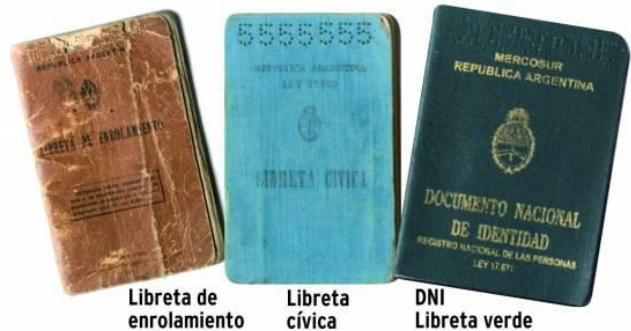
Libreta de enrolamiento